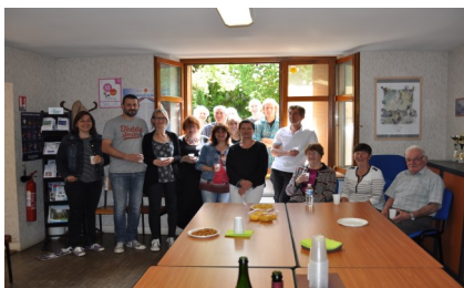
Accueil des nouveaux habitants et remerciement aux personnes qui aident à l'embellissement du village